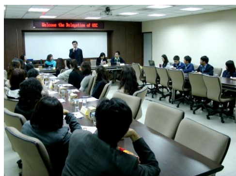
* 接待美國南加大(USC), 與會外賓均對本科學生印象深刻。