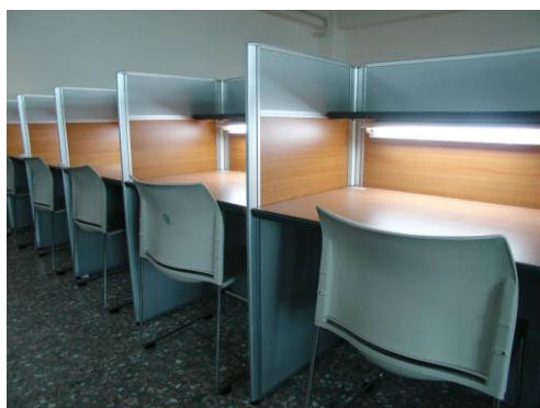
獨立式 K 書中心