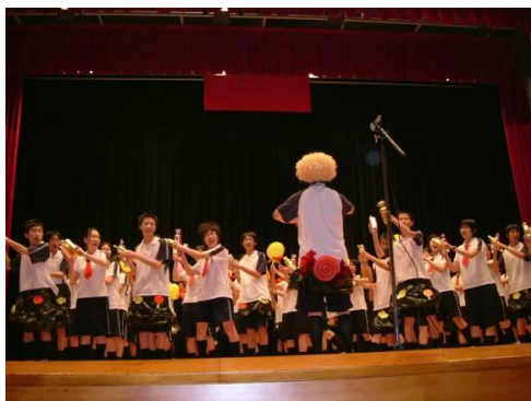
* 英語歌唱比賽，讓同學們快樂學習英文，提升學習興趣。

(四) 豐富有趣的學習活動 ：除了加強各考科學習及通過英文檢定外，本科舉辦許多有趣的活動與競賽。如英文歌唱比賽、說故事比賽、戲劇比賽、朗讀比賽、查字典比賽、作文比賽等，讓同學從活動中運用所學知識，更藉由生動有趣的活動激發學生學習的興趣。