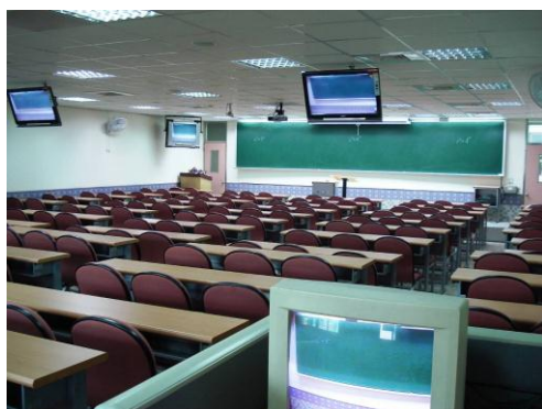
大型學科輔導教室