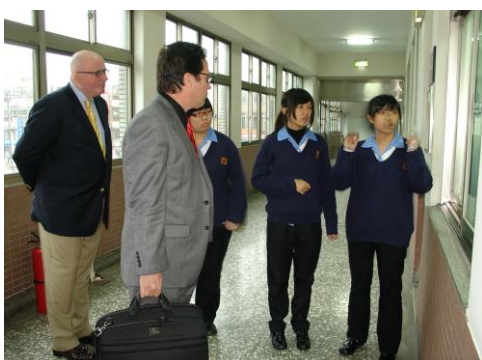
* 接待美國 Fairmont 代表團。圖為學生正用流利的英語對參訪團簡介。