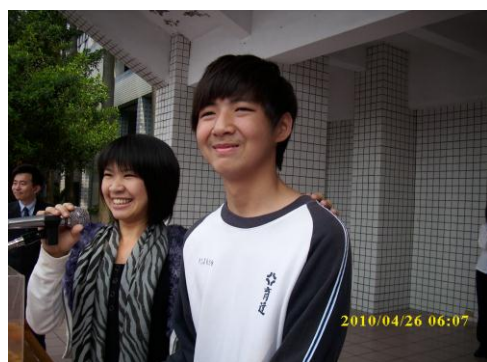
* 緊張萬分，比頭腦還比臺風的單字比賽