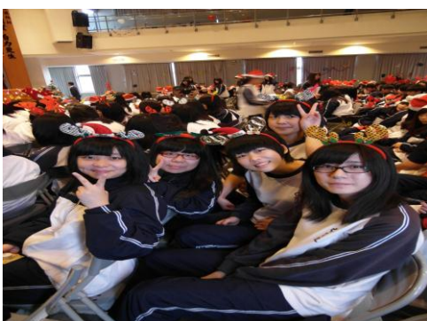
* 溫馨感人，充滿聖誕氣息的聖誕派對。