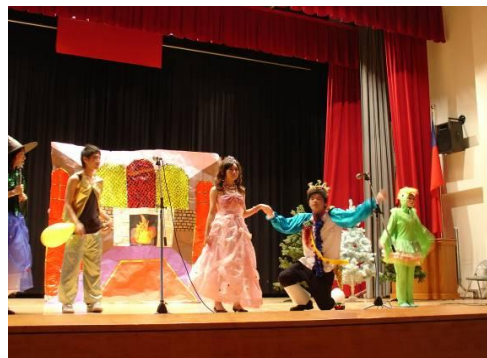
* 英語戲劇比賽，讓同學學以致用，使英文內化程度自然流露。