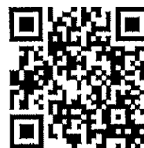
工作坊相關資訊 QR code

三、配合本比賽計畫將於 108 年 12 月間辦理「性教育微電影教材與教學設計工作坊」，歡迎全國有興趣之教師參加。（相關資訊請上 https://s.yam.com/kxUSD 查詢）