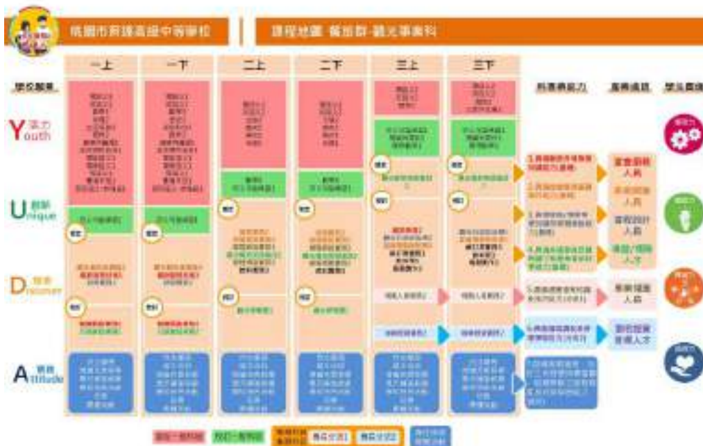
(一十二) 餐飲管理科(&4080)