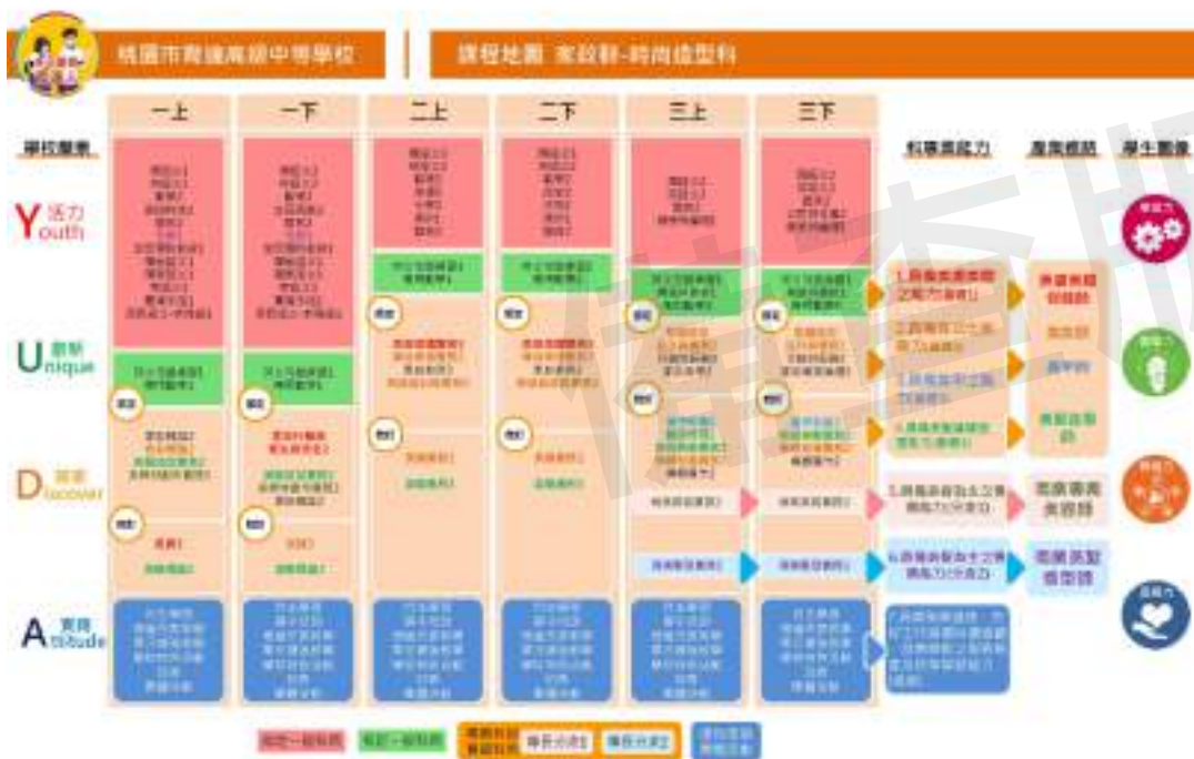
(一十一) 觀光事業科(&4070)